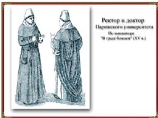
Ректор и доктор Парижского университета По миниатюре “В граде божием” (XV в.)

Учащиеся университета- студенты (лат.studens - занимающийся) также имели свои организации – землячества. Землячества объединялись в нации. Каждая нация объединяла студентов разных национальностей. К примеру, к галльской “нации” кроме французов, принадлежали испанцы, итальянцы и даже выходцы с Востока. Коллектив университета был, таким образом, интернациональным образованием.